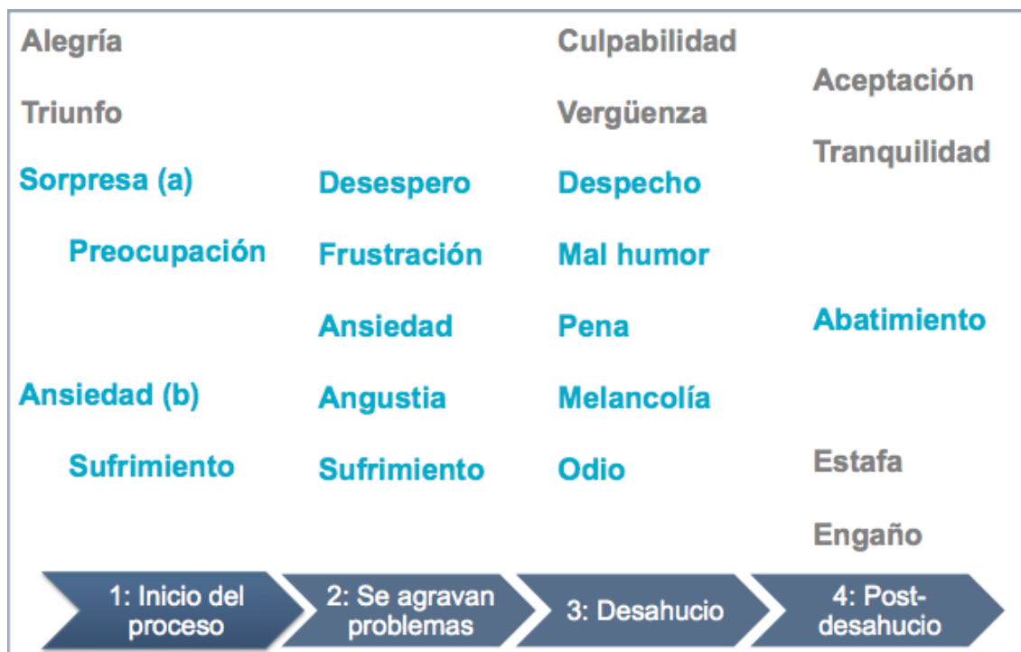
Figura 4. Localización de los sentimientos en el proceso de desahucio

En cuanto a la primera etapa, inicio del proceso, destacan los sentimientos de alegría y triunfo que expresan algunos afectados, en concreto mujeres afectadas, en relación al momento en el que obtuvieron la hipoteca y pudieron tener una vivienda en propiedad. Por lo que respecta al momento en el que se dan los eventos críticos desencadenantes, a partir de éstos algunos expresan sentimientos de sorpresa seguidos de preocupación, mientras que otros expresan ansiedad seguida de sufrimiento. Esa pequeña diferencia parece explicarse según la envergadura del evento crítico desencadenante.