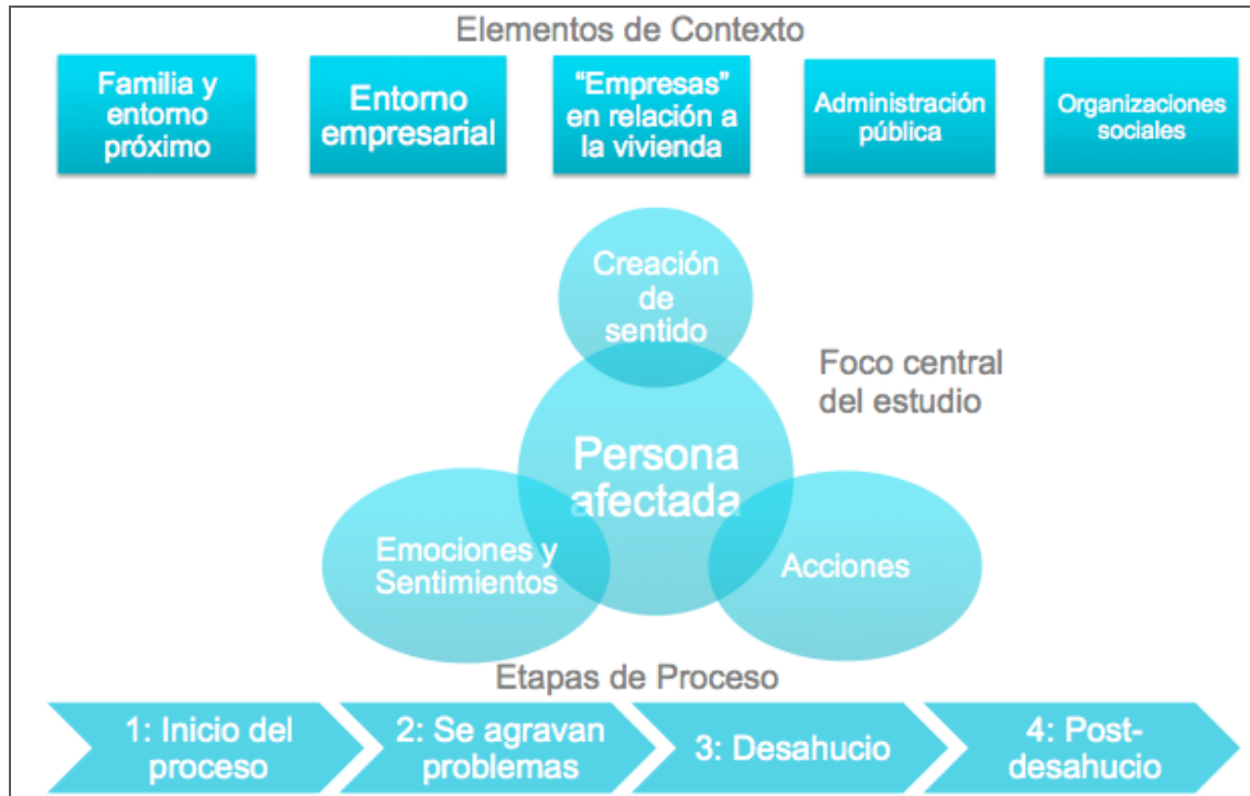
Figura 2. Marco global de referencia del estudio sobre desahucios

Como vemos en el centro del estudio se hallan las personas afectadas por el proceso de desahucio y estudiamos cómo viven todo el proceso en profundidad. Aparece claramente el proceso de desahucio que al final del análisis de datos ha quedado representado por cuatro etapas principales que vienen determinadas por eventos críticos de transición. En la parte superior del marco aparecen los principales elementos de contexto que intervienen, de una forma u otra, durante el proceso de desahucio.